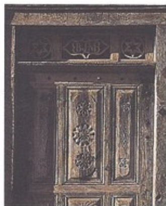
Les portes anciennes, pleines, avec imposte méritent d'être conservées, à défaut elles pourront être refaites à l'identique.

Les volets extérieurs n'apparaissent qu'au XIX e siècle, ce sont presque toujours des volets persiennés.