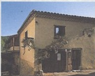
Les maisons du Livradois-Forez