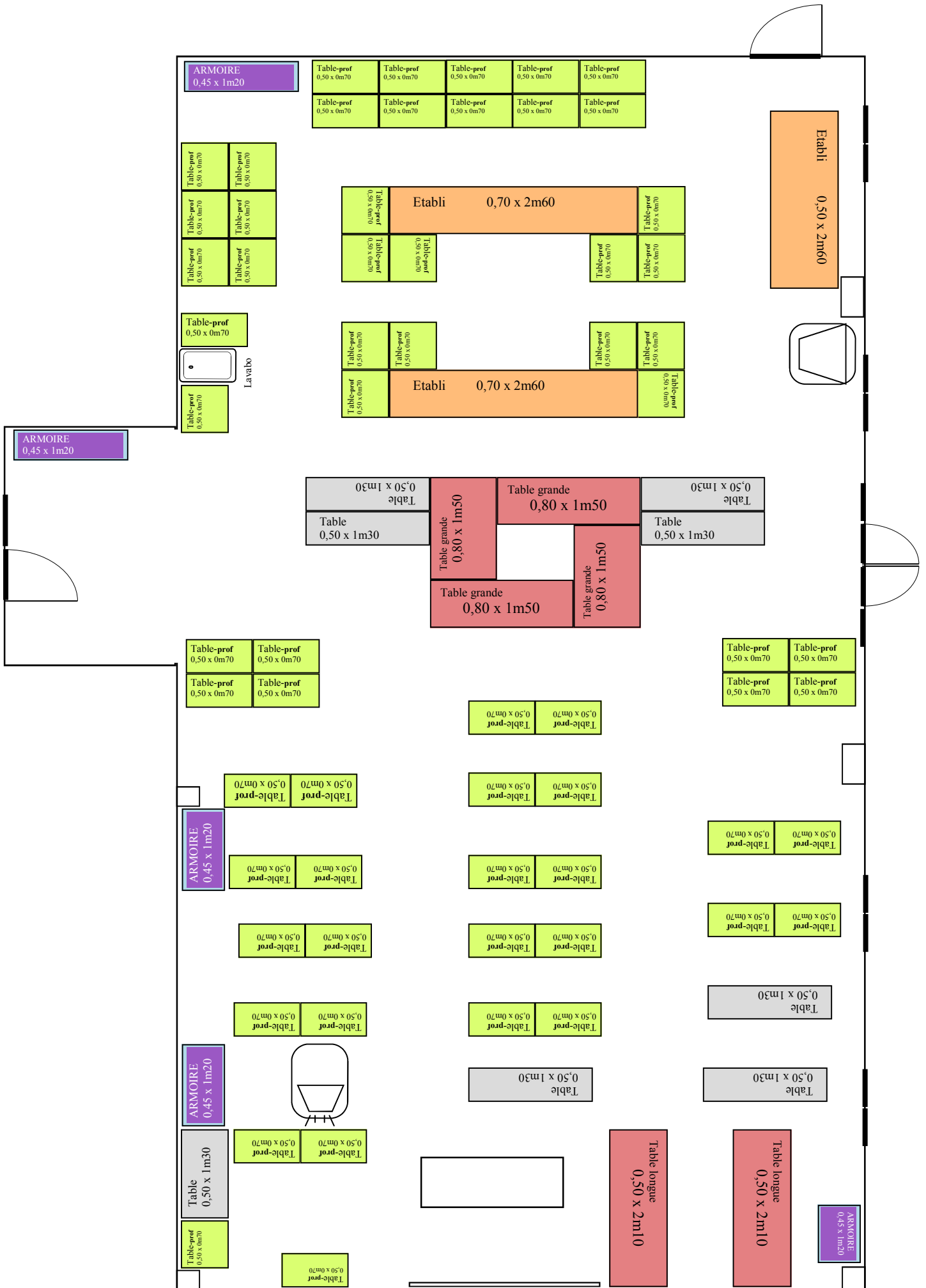
Travail S20 ==> Plan d'agencement à reconstituer