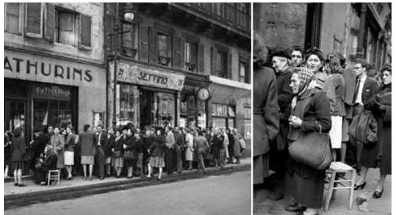
Queue devant une boulangerie en 1947 à Paris

La France ne connaît pas de réelle croissance et la vie est difficile en raison des bas salaires et du coût élevé de la vie.