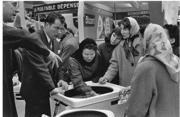
Salon des Arts Ménagers 1956 - H. Cartier Bresson

L'institution de la Sécurité sociale permet de se prémunir contre les aléas qui affectent la vie professionnelle. Parallèlement, la France connaît une situation de quasi-plein-emploi pendant laquelle le taux de chômage est contenu à un niveau compris entre 2% et 3% (contre environ 9,5% en 2005).