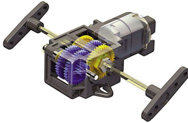
Figure 2 : Motoréducteur TAM-70167 (A4.fr)