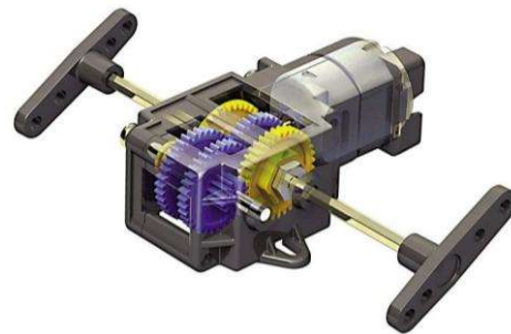
Figure 2 : Motoréducteur TAM-70167 (A4.fr)